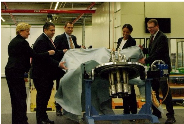
Besuch bei Siemens mit Sigmar Gabriel

Café am Engelbecken, Michaelkirchplatz 24, 10179 Berlin